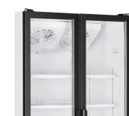
Dveře v plné výšce