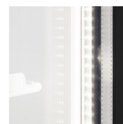
LED osvětlení uvnitř rámu dveří

Chladicí skříň dvoudveřová prosklená s křídlovými dveřmi