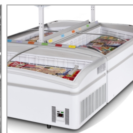
Instalace do ostrovů, police jako příslušenství