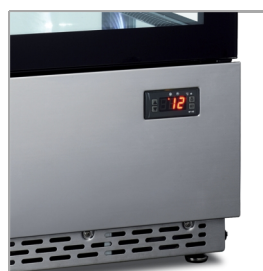
Digitální ukazatel teploty