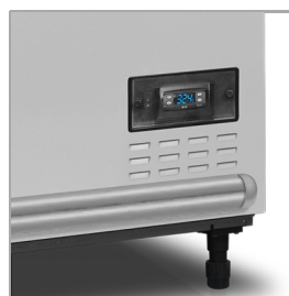
Digitální ukazatel teploty