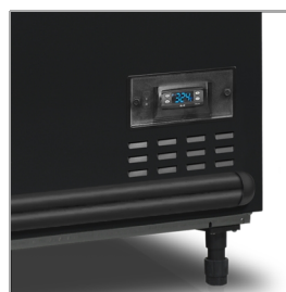
Digitální ukazatel teploty