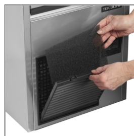
Snadné čištění filtru kondenzátoru