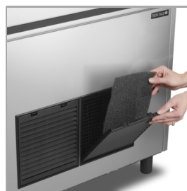
Snadné čištění filtru kondenzátoru