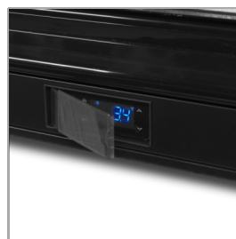
Ochranný kryt na termostat