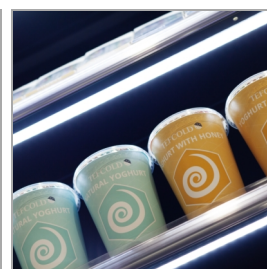
LED osvětlení pod každou policí