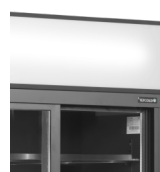
Světelný reklamní panel