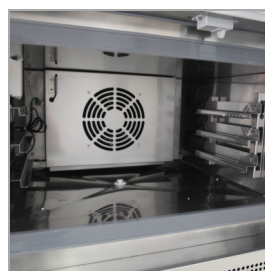
Vsuvy na GN1/1 a Euronorm